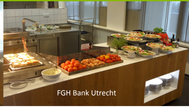
FGH Bank Utrecht