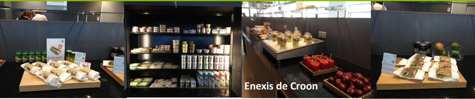
Enexis de Croon