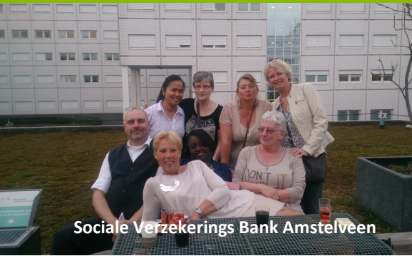
Sociale Verzekerings Bank Amstelveen