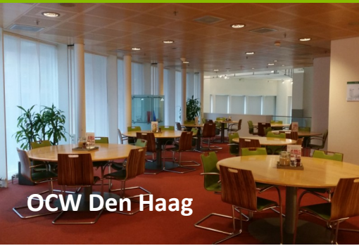
OCW Den Haag