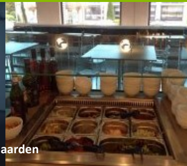
Endress &amp; Hauser Naarden