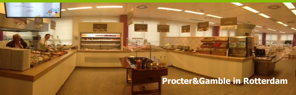
Procter&Gamble in Rotterdam