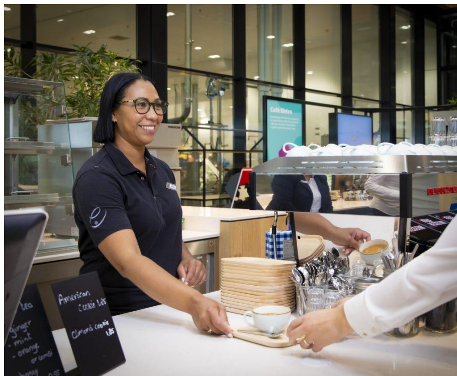
Een beeld wat we de afgelopen twee jaar zo ontzettend gemist hebben. Hospitality zit in onze genen en wij konden het niet laten zien.