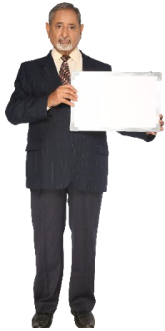
Het jaar 2021 was voor de OR een verkiezingsjaar.

De taken van deze commissie zijn, uiteraard, communiceren met de achterban maar ook organiseren van trainingen en verkiezingen.