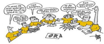
jaarlijks training ondernemingsraad 2021

Gelukkig kon deze training toen wel doorgaan en was dat een heel waardevolle dag!